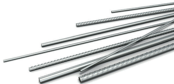
Rys. 1. Zbrojenie ze stali nierdzewnej [M2]

W podanej klasyfikacji rodzajów stali nierdzewnej o strukturze jednofazowej, obok stali austenitycznej i ferrytycznej często wymienia się stal martenzytyczną [N5]. Ma ona skład chemiczny porównywalny do stali ferrytycznej, ale między innymi