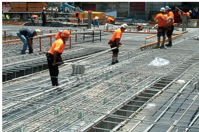
Rys. 4. Budynek G11 Uniwersytetu Nowej Południowej Walii (Australia) ze zbrojeniem z nierdzewnej stali austenitycznej [M2]

Przedstawiona w niniejszym artykule analiza wad i zalet stosowania stali nierdzewnej, jako zbrojenia konstrukcji betonowych, wskazuje na bardzo interesującą alternatywę dla typowej stali węglowej pod kątem wydłużenia trwałości żelbetu. Podstawową wadą stosowania stali nierdzewnej będzie zapewne wzrost kosztów inwestycji na etapie jej wykonania. Ale w perspektywie planowanej kilkudziesięcioletniej eksploatacji